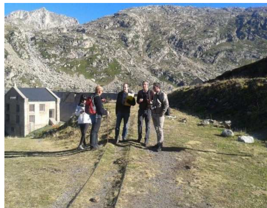
Projecte Tren dels Cims

JUSSACTIU, DALEPH i el Consell Comarcal del Pallars Jussà està treballant amb la proposta per a la realització de un estudi en el marc d'un Pla d'Acció de suport al desenvolupament de la Cervesa artesana al Pallars Jussà. Actualment estem tenim les últimes reunions per acabar de definir el Pla Estratègic.