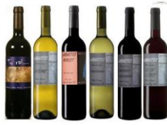
Vi Vila Corona

Uns premis que ajuden al producte pallarès, en aquest cas vi i licors, a posicionar-se com a producte de bona qualitat arreu del món.